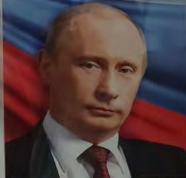
Путин В. В.